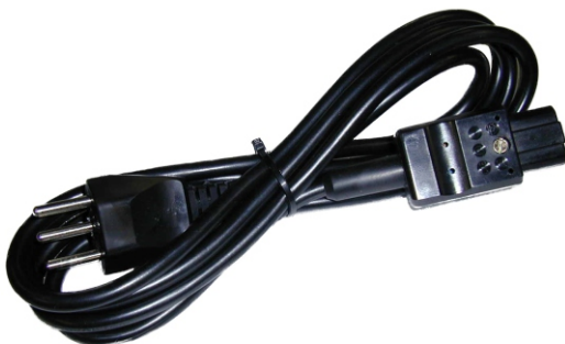
Zuleitung zu Typ 888

PROBAG Gasdurchflusserhitzer werden auf den Kupferstutzen mit passendem Anschlussgewinde für die verschiedensten unbrennbaren Gase geschraubt. Der Stutzen wird mit Heizelementen beheizt, welche durch einen Thermostaten geregelt werden. Als zusätzlichen Überhitzungsschutz ist eine Übertemperatursicherung eingebaut.