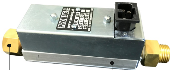
Rohrstutzen Art. 53556

Die Geräte sind selbstregelnd. Damit wird ein störungsfreier Betrieb der Anlage jederzeit gewährleistet. Einsatzbereich: Z.B. bei zentraler Sauerstoffversorgung in Krankenhäusern, bei Schutzgas-Schweissanlagen, Neutralisationsanlagen auf Baustellen oder bei Schankanlagen.